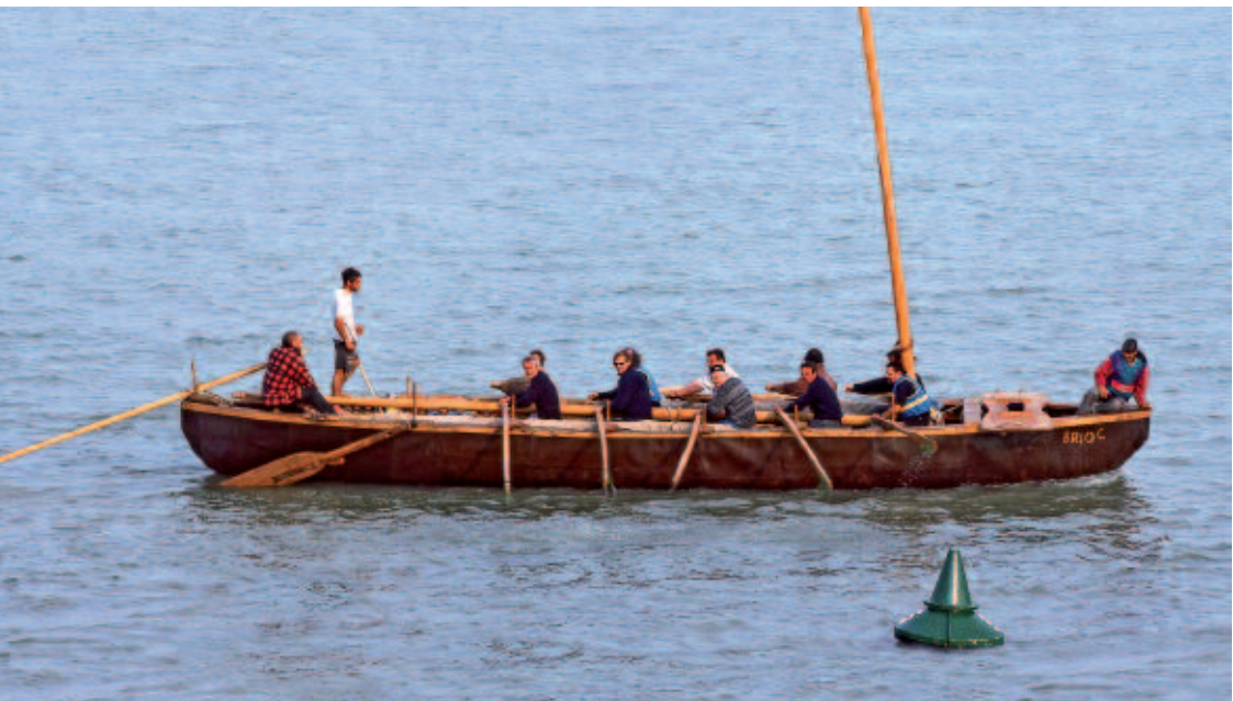
Premiers coups de rames vers le large pour les acteurs de ce magnifique projet, la construction du Coracle (bateau celte).

Visites de 15 à 18 heures, les samedi 23 octobre, mercredi 27 octobre, samedi 30 octobre, mercredi 3 novembre, samedi 6 novembre, mercredi 10 novembre, samedi 13 novembre et dimanche 14 novembre.